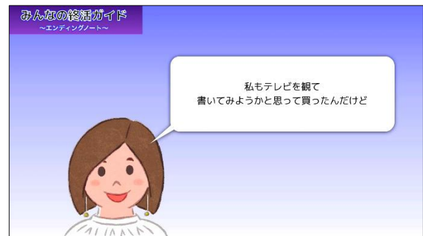
長女 愛さん 52才も興味をもっていた