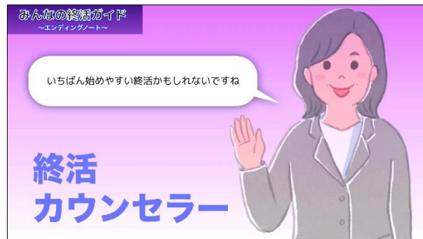
エンディングノートについてアドバイスする終活カウンセラー