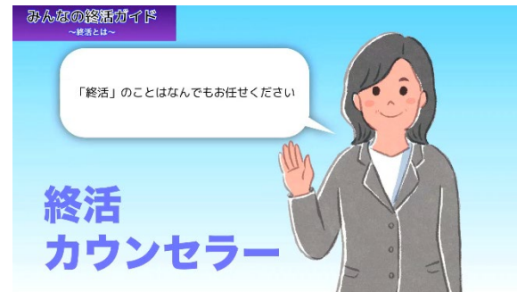
終活のプロ「終活カウンセラー」